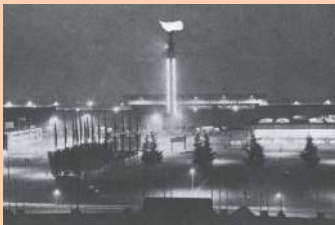
Η Φλόγα της ένατης Ολυμπιάδας του 1928 καίει στο Ολυμπιακό Στάδιο του Άμστερνταμ

• Η Φλόγα εμφανίστηκε για πρώτη φορά το 1928 για τις ανάγκες της 9ης Ολυμπιάδας του Άμστερνταμ καθώς και στην επόμενη, έπειτα από τέσσερα χρόνια, στο Λος Άντζελες, το 1932. Επίσης φλόγα φώτισε και τους Χειμερινούς Ολυμπιακούς Αγώνες που πραγματοποιήθηκαν στο Γκάρμις-Παρτενκίρχεν στη Νότια Γερμανία στις αρχές του 1936.