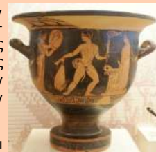
Ερυθρόμορφος καλυκτός κρατήρας με παράσταση σατύρου—λαμπαδηφόρου. Αρχαιολογικό Μουσείο Ολυμπίας. 4ος αι. π.Χ.

• Οι άνθρωποι αναγνώρισαν την εξαιρετική πράξη, το δώρο του Προμηθέα προς αυτούς και καθιέρωσαν την λατρεία του. Ο Υγιнос, συγγραφέας του 1ου αι π.Χ., αναφέρει ότι οι άνθρωποι, στις αθλητικές διοργανώσεις τους περιελάμβαναν λαμπαδηδρομία, τιμώντας τον Προμηθέα για την κλοπή της φωτιάς από τους Θεούς.