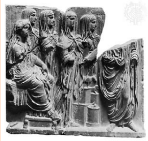
Ανάγκυφο με την Εστία (Vesta) καθισμένη στα αριστερά της παράστασης και χορό εστιάδων παρθένων. Μουσείο Παλέμιο

• Με τον καιρό η σημασία της λατρείας της Vesta αυξήθηκε δραματικά. Εάν, λόγω έλλειψης προσοχής και φροντίδας εκ μέρους των ιερειών η φλόγα της πόλης και κυρίως της πρωτεύουσας της αυτοκρατορίας Ρώμης έσβηνε, σοβαρές τιμωρίες, ακόμη και θανατική ποινή της περιέμεναν. Όπως μαρτυρά ο Πλούταρχος στη βιογραφία του Νουμά, η ιερή αθάνατη φωτιά που μόνο από ατύχημα θα μπορούσε να σβήσει, επιτρεπόταν να τοποθετηθεί ξανά στο βωμό έπειτα από συγκεκριμένη διαδικασία ανάκτησης, αφού δηλαδή την είχαν ανάψει από τις ακτίνες του ήλιου με τη χρήση ενός μεταλλικού καθρέπτη.