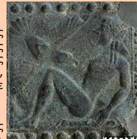
Προμηθέας Δεσμώτης και ο αετός που καταβροχθίζει το σκώπιό του. Σφυρήλατη παράσταση σε τμήμα χάλκινου οχάνου (εξάρτημα στην εσωτερική πλευρά ασπίδας). 6ος αιώνας π.Χ. Αρχαιολογικό Μουσείο Ολυμπίας.

• Ο Προμηθέας κατατάσσεται ανάμεσα στις πλέον σημαντικές μορφές της Ελληνικής μυθολογίας. Είναι ο φιλεύσπλαχνος Τιτάνας ο οποίος χαρίζει στους ανθρώπους τη φωτιά, το πανίσχυρο στοιχείο, προνόμιο μέχρι τότε μόνο των θεών.