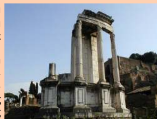
Ο κυκλικός ναός της Vesta στο Forum Romanum. Ρώμη. 191 π.Χ.