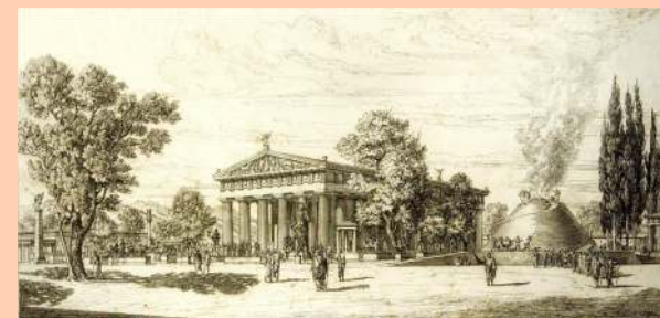
Σχεδιαστική - υποθετική αναπαράσταση του ναού και του βωμού του Διός στην Ολυμπία. Fr. Adler

«Είθε η Ολυμπιακή Φλόγα να συνεχίσει το δρόμο της μέσα στους αιώνες, και να συμβάλει στην εμπέδωση της φιλίας και κατανόησης μεταξύ των εθνών, για το καλό της ανθρωπότητας»