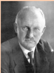
Carl Diem, Γενικός Γραμματέας της Οργανωτικής Επιτροπής της Ολυμπιάδας του Βερολίνου,